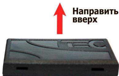
Рис. 3. Размещение модуля в автомобиле

Уверенный прием сигнала делает модуль не очень требовательным к месту установки, однако следует учесть, что зона наиболее уверенного приема сигнала со спутников – у лобового стекла автомобиля. Расположите модуль горизонтально (см. рисунок 3). Допускается установка модуля под пластиковые и резиновые детали автомобиля.